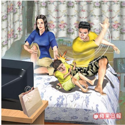
惡情侶聯手虐童亡。示意圖