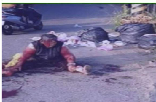
婦人癱軟，坐在地上。翻攝照片