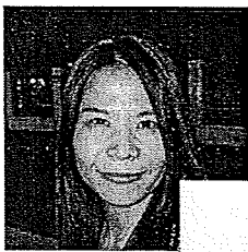
林小姐 31歲 秘書

【民眾看瀕死婦被當教具】 傷痛可理解 死者家屬的傷痛可以理解，但衣不蔽體與死因不見得有因果關係。