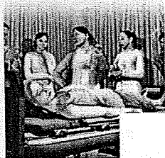
死前痛苦 衣不蔽體 男子指控，重病的母親衣不蔽體地被女老師拿來示範教學1小時，結束4小時後即病逝。