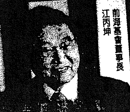
前海基金會董事長 江丙坤