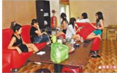
高雄仁武星辰地 KTV 女服務生年輕、歌好，才開業 20 多天就聞名遠近，翻攝畫面