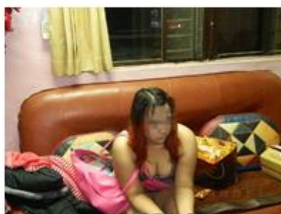
印尼女「珍妮」為養家下海賣淫。翻攝畫面